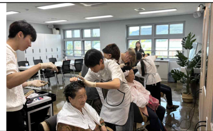
< 헤어미용 >