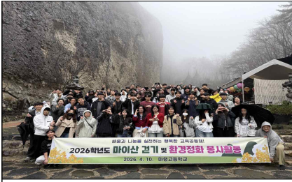
< 마이산 봉사활동 >