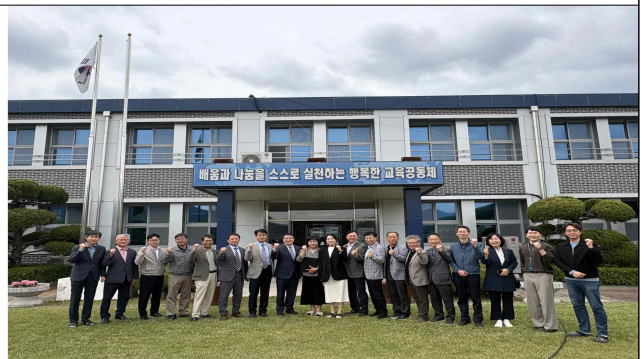
< 마령고 방문 기념 >