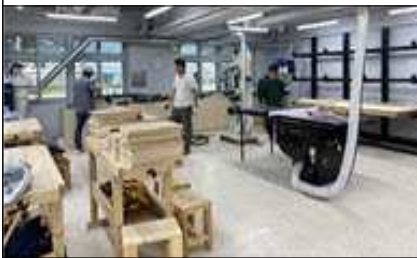
< 실용목공 >