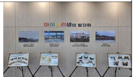
< 마이누리샘 연혁 >