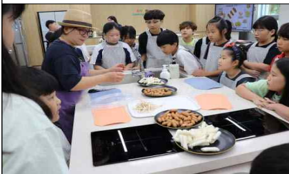
< 요리누리실 >