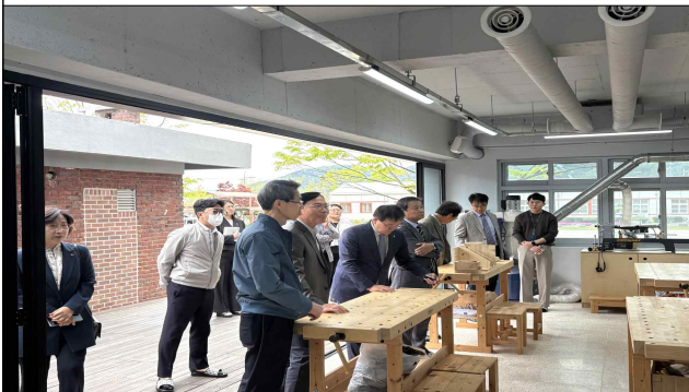
< 마령고 실용목공실 >