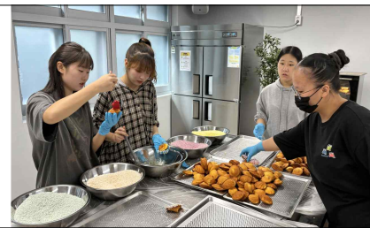
< 제과제빵 >