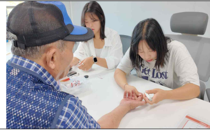
< 진로봉사의 날 >