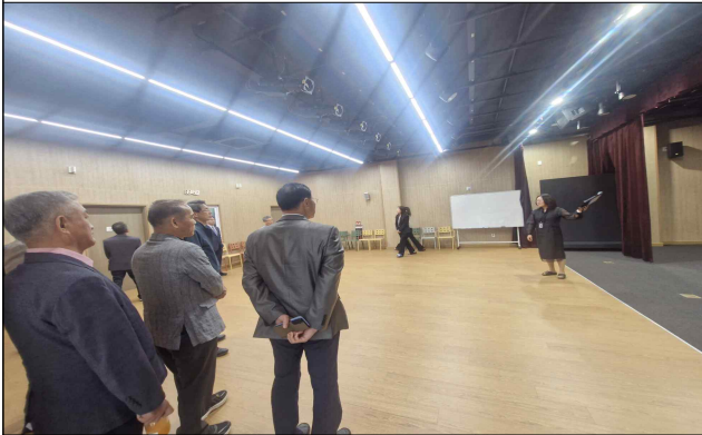
< 마이누리샘 연극누리실 >