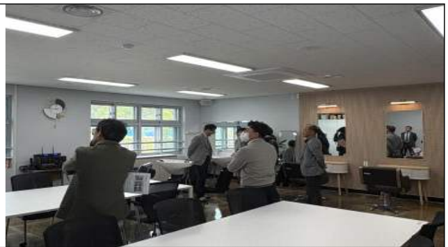
< 마령고 헤어미용실 >