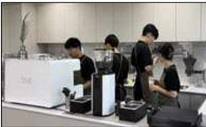
< 바리스타 >