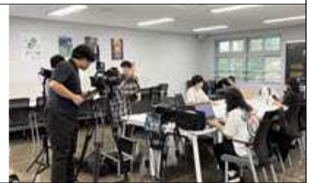
< 영상제작 >