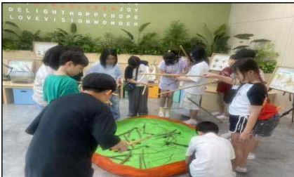
< 곤충교실 >