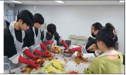
< 김장봉사 >