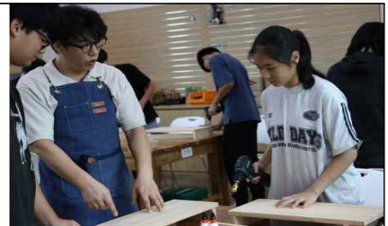
< 마이목공실 >