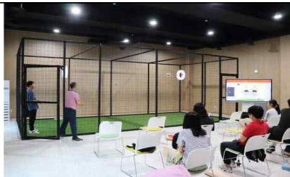
< 마이드론실 >