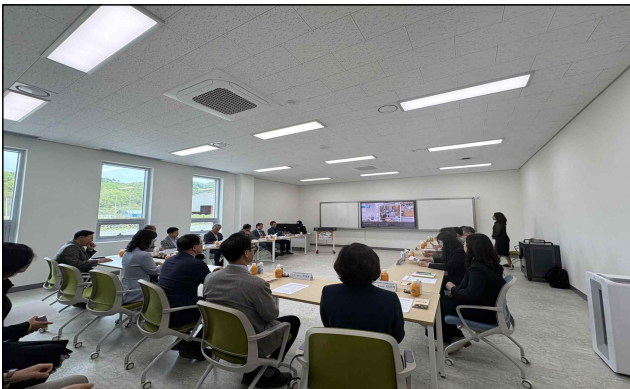
< 마이누리샘 현황 설명 >