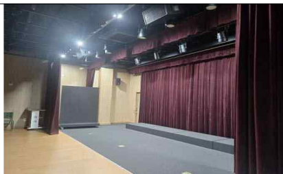
< 연극누리실 >