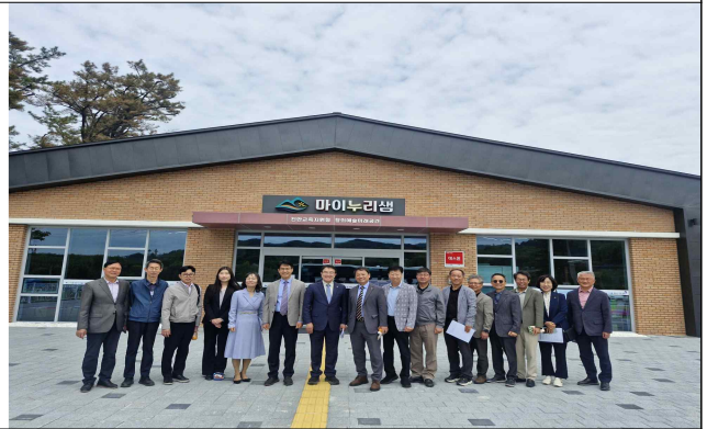
< 마이누리샘 방문 기념 >