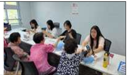
< 보건간호 >