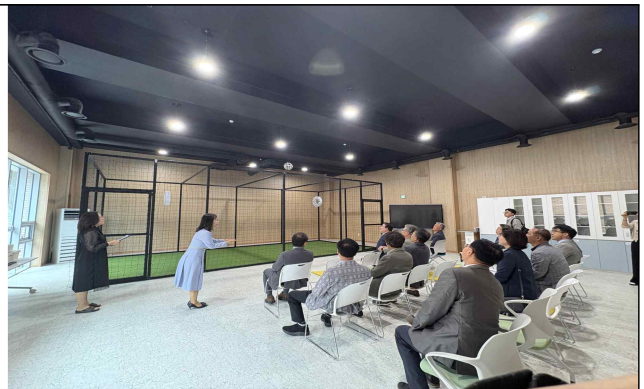
< 마이누리샘 마이드론실 >